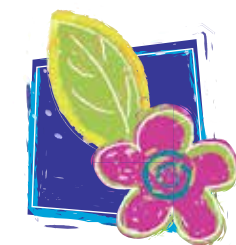
Еколошки покрет Земун